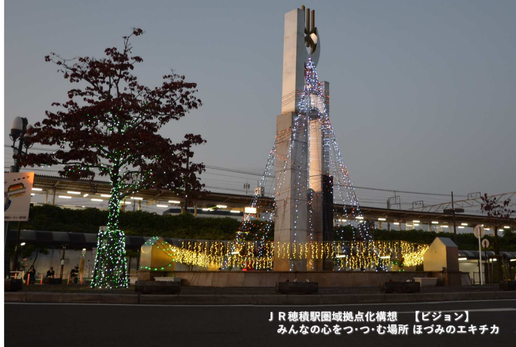
J R 穂積駅圏域拠点化構想 【ビジョン】 みんなの心をつつむ場所 ほづみのエキチカ

「穂積駅周辺まちづくり ニュースレター」は、駅周辺のまちづくりに関する検討の内容や進捗の状況をお届けしていきます。